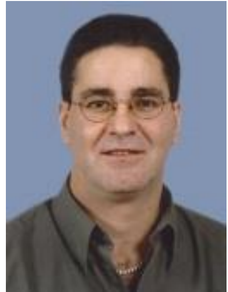
L'équipe de Techniques d'usinage

Merci! pour avoir passé ces années avec nous !